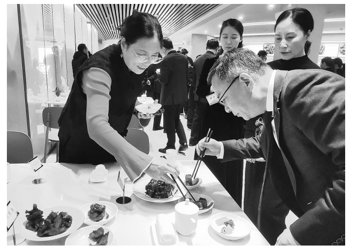
受邀嘉宾现场点评餐厅菜肴。

本报讯 记者胡坤摄影报道 小小食堂,大大民生。昨日下午,杭州“西子餐厅美食节”活动在中国铁路上海局集团有限公司杭州客运段杭客职工食堂启动,这里还有一个更动听的名字——“西子餐厅”。