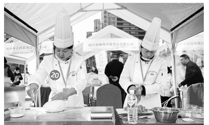
参赛选手全神贯注展示手上功夫。

本报讯 记者胡坤 通讯员祝森群报道 由嵊州市总工会、市商务局、市农业农村局、市商业集团、浦口街道办事处联合主办,浦口街道总工会承办的“包包相会 相约浦口”2024年嵊州市小笼包技能比武大赛于日前在嵊州和悦时代广场举行,活动吸引了全市22家小笼包企业的44名代表一较高下。