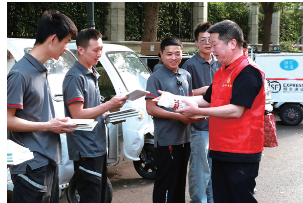
记者将书籍送到小哥们的手中。

本报讯 记者寿慧楠、邹伟锋报道 昨日是“世界读书日”,浙江工人日报社全媒体采访中心党支部来到结对驿站杭州市拱墅区半道红社区工会驿站开展“我在工会驿站当‘站长’”实践活动。记者化身站长,将一本本劳模读物、经典书目以“快递”的方式送到了小哥们